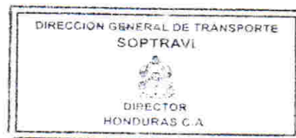
DIRECTOR GENERAL DE TRANSPORTE