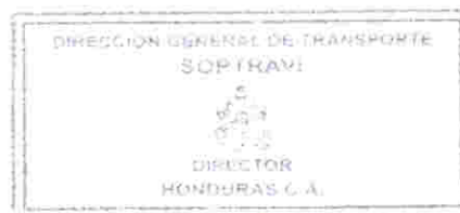
DIRECTOR GENERAL DE TRANSPORTE